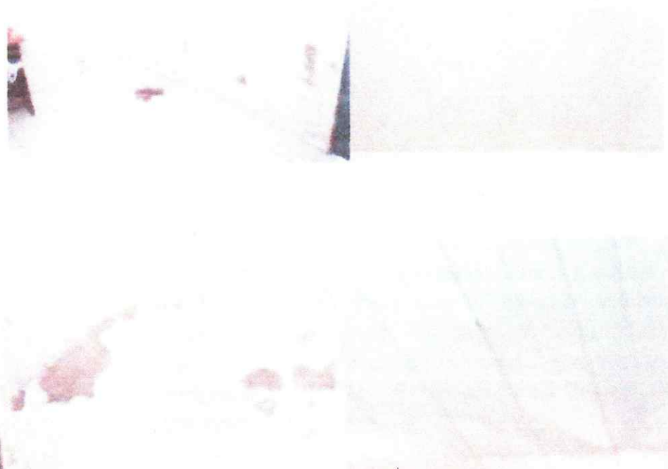
Imagens do PPD/PM – Santa Maria do Uruará – Prainha/PA

IMAGENS RELACIONADAS AO ASSUNTO MENCIONADO NO REQ. Nº 001/2021 – GB/HGP